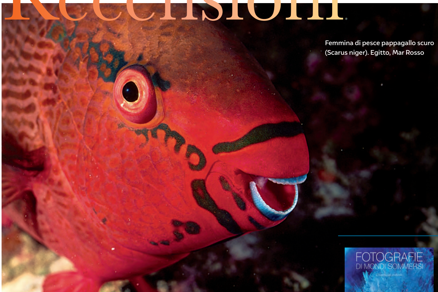
Femmina di pesce pappagallo scuro (Scarus niger). Egitto, Mar Rosso